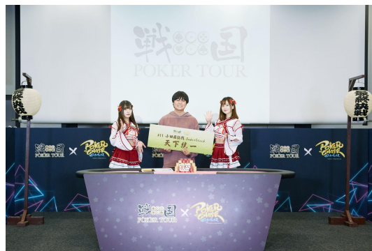
前回の将軍:うきょう