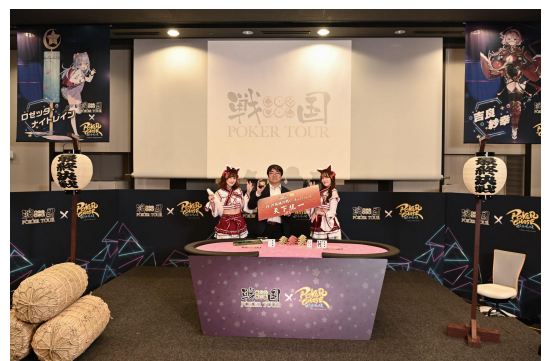
前回の将軍: マジキチ