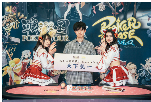
前回の将軍: フクシマ