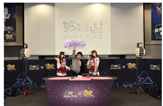
前回の特車:はいはい一りりり