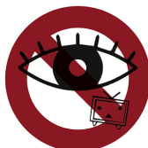
会場での大会放送視聴は禁止