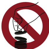
チップは一度に出しましょう

ゲームの妨げになるような大声での会話、禁止されたエリアでの喫煙や電子タバコの使用、周囲の視界を妨げるような帽子の着用、音楽プレイヤーの音漏れやゲーム進行の阻害行為、故意的なゲームの遅延、プレイ批判、カードを強く折り曲げるなどのマーキング、プレイヤー同士のサイドベット、他のプレイヤーの迷惑になるようなニオイや服装などはエチケット違反となる。重度の違反についてはペナルティや退場の処分となる場合がある。