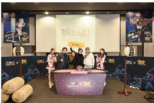
前回の将軍達: 横浜APPT同盟軍