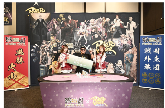
前回の将軍:ルイス