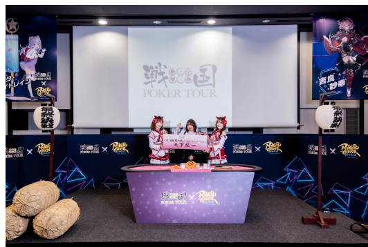
前回の将軍:まよんぬ