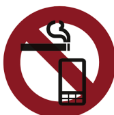
ゲーム中の携帯操作や視聴禁止 座席での喫煙・通話は禁止