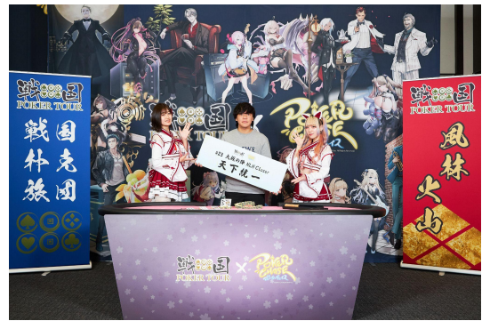
前回の将軍:しょうご