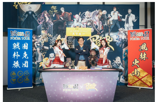
前回の将軍: あ. キラー