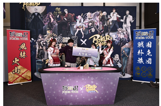
前回の将軍: きくりん&あやか