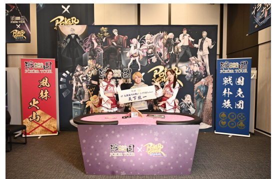
前回の将軍:りゅうたろう