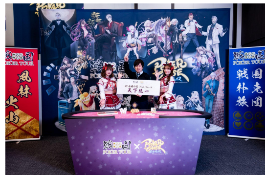
前回の将軍: タートル