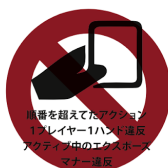
ペナルティに注意